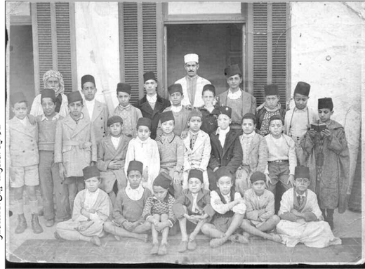
تلاميذ المدرسة إبان الاستعمار