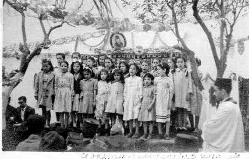
مجموعة تلاميذ مدرسة السعادة عام 1934

مسجد المدرسة اليوم يحمل كل هذا الإرث الوطني وله مكانة خاصة عند الناس لأنه جزء من تراث ونضال العاصمة، كما يرتبط ببقام الشهيد العربي تبسي، لذلك سارع سكان بلكور في السنوات الأولى للاستقلال بتحويل كنيسة الحامة إلى مسجد وأعطوه اسم الشهيد العربي تبسي كعرفان لما قدمه لهم، ليصبح هذا المسجد منارة للمعلم والدين وزاره العديد من المشايخ، منهم عبد الرحمان الجيلالي والإمام محمد الشعراوي وغيرهما. كما كان حصنا للوحدة الوطنية ووقف ضد كل التيارات الدخيلة على ديننا السمح، حسبما قاله بعض المصلين، ومنهم الإمام السابق له الشيخ إسماعيل.