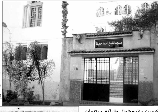
مسجد المدرسة اليوم

ولا أرى أن هناك في العالم العربي من يجاريه في هذا المضمار... وكانت دروسه في التفسير نادرة»، وقال عنه العلامة ابن باديس «إن الأستاذ العربي ابن الزيتونة، والأزهري مشاركا مشاركة قوية في علوم الشريعة والآداب، ذكي الفؤاد، صحيح الفكر والعلم، فصيح اللسان، محجاج قوي الحجة، حلو العبارة... شديد الحب لدينه ووطنه، شديد في الدفاع عنهما».