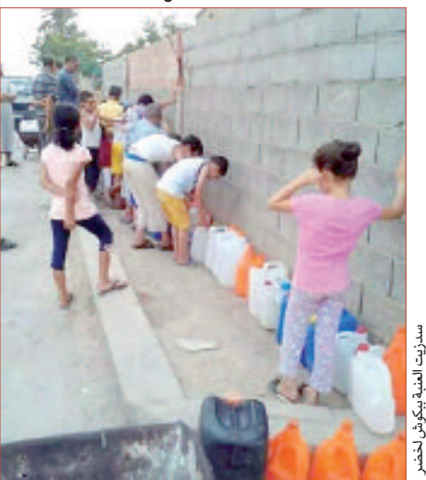
سدريت العينة ببلدية الحروش

للإشارة، فإن طاقة استيعاب سد بني زيد تقدر بـ 40 مليون متر مكعب، ويوزع 4 بلديات بمنطقة القل بالماء الشروب، وكغيره من السدود يعرف تراجعا كبيرا في منسوب مياهه بسبب الجفاف والحر الشديد ويسبب ارتفاع منسوب الطمي فيه.