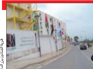
قرية الفنانين بزرادة

ينظم كل من الديوان الوطني للثقافة والإعلام والديوان الوطني لحقوق المؤلف والحقوق المجاورة، قافلة صيف الجزائر 3، التي تضم مهرات فنية وعروضاً موجهة للأطفال وتوجب ولايات الوطن بمشاركة عدد من الفرق والفنانين الجزائريين ما بين 17 و29 أوت 2017، بمساهمة التلفزيون الجزائري والإذاعة الوطنية، وتحت إشراف وزير الثقافة والداخلية والجماعات المحلية والتهيئة لعمرائية. وستطلق القوافل يوم 17 أوت بداية من الساعة 09 صباحا بقرية الفنانين بزرادة، وستحل القافلة الأولى بولايات سكيكدة، عناية، قالمة والطارف، في