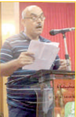
الشاعر حسين داراس