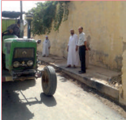
طريق بلدية مولاي العربي