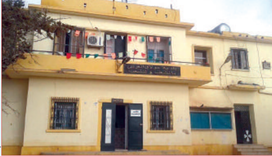
مقر بلدية مولاي العربي

سعيها منها للوقوف على واقع المشاريع التنموية وأوضاع المجالس البلدية في ظل الصراعات التي ميزت العهد السابقة إضافة إلى سلسلة الإصلاحات التي تباشرها الصالح الولائية وقفا عند تعليمات وتوصيات وزارة الداخلية، والهادفة أساسا إلى التكفل بأنشطة المواطنين مع العمل على تحسين العلاقة مع الإدارة وتنفيذ الخطط