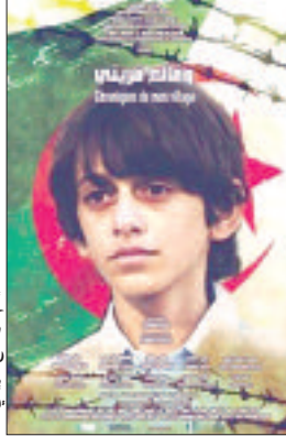
مشهد من فيلم «وقائع قريتي»