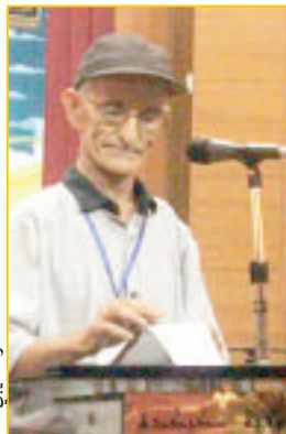
الشاعر حسين داراس