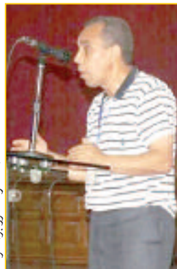
الشاعر عاشور بوالكلوة

بالتنسيق مع مديرية الثقافة لولاية سكيكدة ودار الثقافة محمد سراج، سيبدأ من 23 أوت إلى 25 أوت الجاري، كنس احتضان قاعة الفنون التشكيلية للفنون الدار، معرضا للفنون التشكيلية بمشاركة عدد من الفنانين الذين قاموا بعرض مجموعة من اللوحات الفنية لمختلف المدارس، تعبر أيضا عن الوطن والمرأة والحرية والطبيعة.