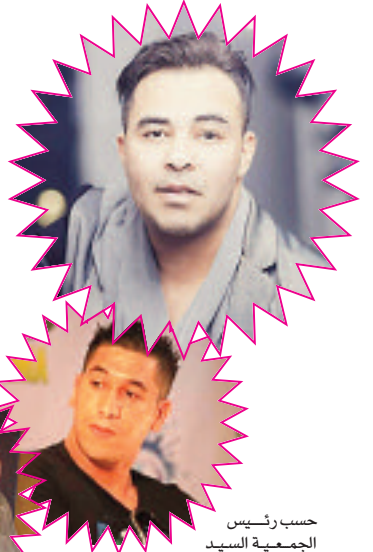
حسب رئيس الجمعية السيد