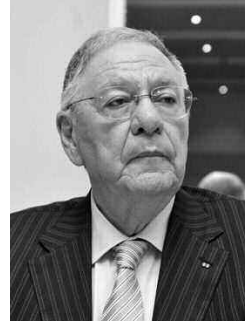
على حد تعبيره. وحصر ولد عباس الحدث المهم

نقى الأمين العام لحزب جبهة التحرير الوطني، جمال ولد عباس، أمس، ممارسة الأفلاّن وحلفائه من أحزاب الموالاتة والتنظيمات الجماهيرية، «ضغطا على الرئيس بوتفليقة للترشح لعهد جديد»، موضعا بأنه في حال رفض رئيس الجمهورية التقدم لعهد جديد فإن «الأفلاّن لن يعيد عن احترام قرار الرئيس وتطبيق تعليماته بصفتهم رئيسا للحزب».