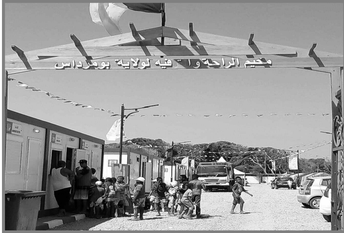
الاختلاف إلا في التفاصيل، تقول فطيمة.