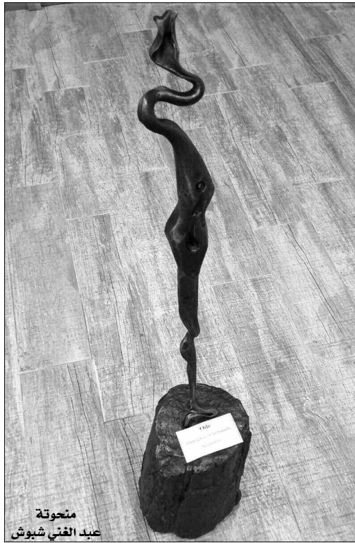
منحوتة عبد الغني شبوش

ومن بين اللوحات التي يشارك بها مجيد نجد لوحة "القصة الخالدة" التي رسم فيها مجيد المحروسة بألوان مزهر مثل معظم لوحات مجيد التي تشع حياة وجمالا، فظهرت القصة مدينة جذابة حيث تقطن فيها الفرحة. لوحة ثانية لقمرود بعنوان "شمس للجميع" رسم فيها بشكل طفولي منظم، شمس كبيرة تشع نورا وتتوسط سماء متعددة الألوان، في منظر يضم طريقا أحمرًا ومباني زرقاء. كما يعرض أيضا لوحة "الرجل الأزرق"، حيث رسم رجلا باللون الأزرق تحيط به مختلف الأشكال الهندسية الجميلة ومتنوعة الألوان. إضافة إلى لوحات أخرى مثل "مسار مغاربي" و"الحياة بكل بساطة" و"الزربية بين الأسس واليوم".