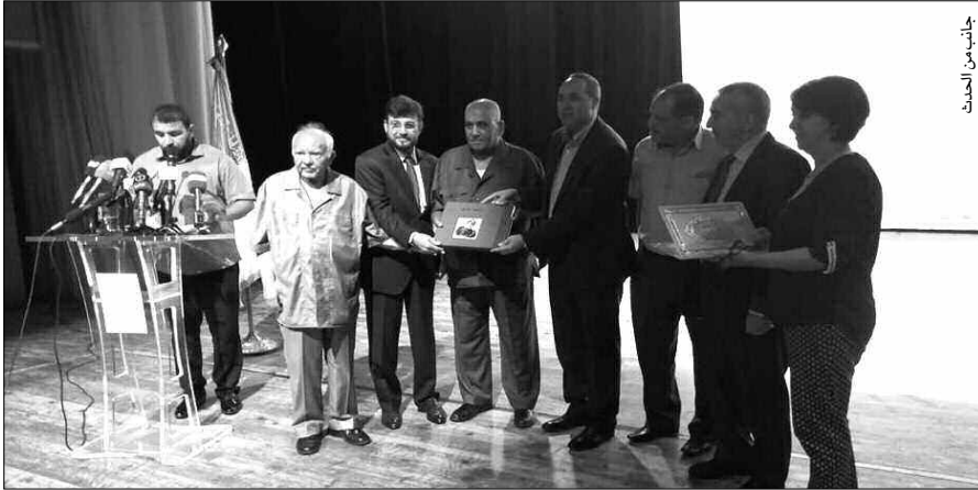
الوزير الوزير الوزير

قال ميهوبي إن الاحتفاء بدرويش واجب لا محالة، كما إنه امتثال لاختيار الأسكو؛ "درويش شخصية السنة الجارية"، مضيفاً أن درويش يشكل أيقونة للثقافة الفلسطينية، وقدم الكثير للقضية، لينتقل إلى الحديث عن بعض النوادر التي جمعتها بدرويش، فقال إن أول لقاء جمعه به كان سنة 2004 بفكرافورت بمناسبة تنظيم الصالون الدولي للكتاب، حيث انبهر بالإقبال الكبير على أمسية بدرويش الشعرية، خاصة من طرف الألمان، ليكون اللقاء الثاني بالرباط، حينما أجريت عليه عملية جراحية. أما اللقاء الثالث والأخير فكان سنة 2005، حينما استضيف درويش بالجزائر بعد تلقيه دعوة من طرف رئيس الجمهورية، حيث أحيى، بالمناسبة، أمسية شعرية خالدة بقاعة "ابن خلدون".