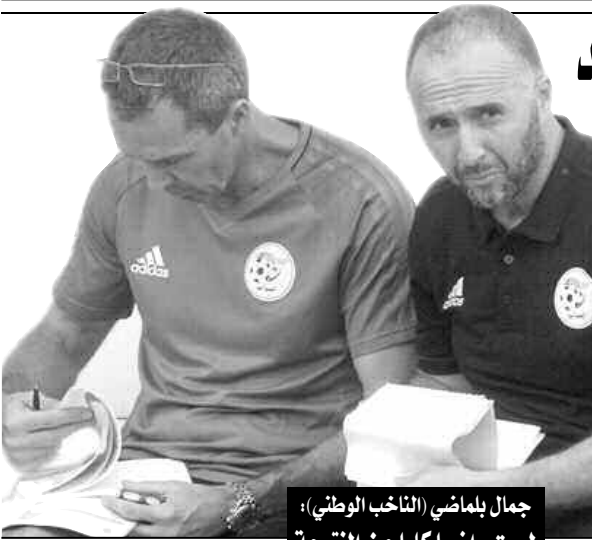
جمال بلماضي (الناخب الوطني)؛