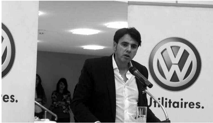
الوزير السابق عبد الحميد بن باديس يتحدث في مؤتمر صحفي.

قدمت فصيلة الأبحاث للدرك الوطني أول أمس، 17 شخصا في قاعات ذات طابع جزائي أمام وكيل الجمهورية لدى محكمة سيدي امحمد، حسبما أفاد به أمس، بيان لذات الهيئة.