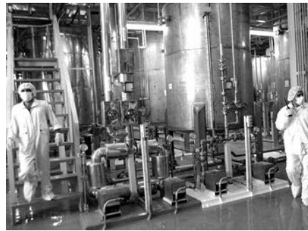
كما ذكر عرقاب في سياق متصل، بأن المركزين الخاصين بالطاقة النووية بكل من دراية وبيبرين بالجزيرة، يخضعان لمتابعة

للإشارة فقد تمت صياغة هذا النص في 19 فصلا تتضمن 156 مادة، منها مواد جزائية، فيما سيتم بموجب نص المشروع القانون إنشاء لدى الوزير الأول، سلطة إدارية مستقلة تدعى «السلطة الوطنية للأمان والأمن النوويين» تسهر على عمليات مراقبة وتفتيش وكذا تقييم المنشآت النووية إلى جانب مساعدة السلطات العمومية في وضع نظام وطني للحماية المادية للمواد والمنشآت النووية.