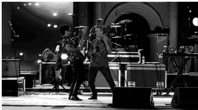
الفرقة الشاوية - فنانين مشاركون

توه فنانو افتتاحوا السهرة الأولى من مهرجان تيمقاد الدولي في طبعته 41، بالجهود المبذولة لإيصال رسالة المهرجان إلى شريحة واسعة من الجمهور، متمين حضوره بعدما قطع أشواط طويلة نحو العالمية.