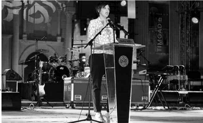
الوزيرة مريم مرداسي.

وأعلنت وزيرة الثقافة، بالمناسبة، عن مشروع تهيئة حديقة ومسار سياحيين، سيتم تجسيده بهذه الجهة على حافة الطريق، وتمويله من ميزانية الولاية مع مراعاة الطابع الثري والموروث الثقافي لهذه المدينة العريقة، فيما سيتم إعادة تهيئة مدخل موقع المدينة الأثرية بتيمقاد وكذا متحفها الذي يضم أجمل الفسيفساء وكذا اللوحات نادرة.