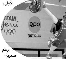
رغم صعوبة المنافسة..