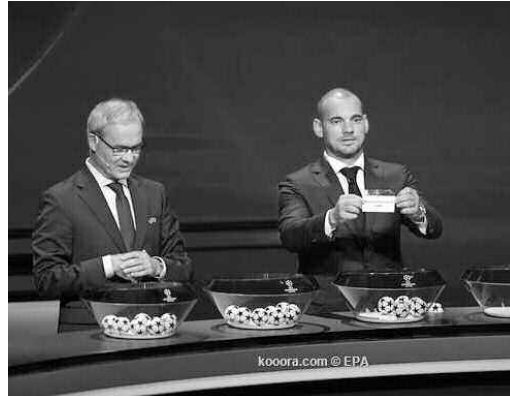
مع برورسيا دورتموند وإنتر ميلان وسلافيا براغ في المجموعة السادسة. كما ضمت المجموعة الرابعة جوفنتوس بطل إيطاليا، وأتليتيكو مدريد وباير ليفركوزن ولوكوموتيف موسكو.

وسيلعب فريق بورغن كلوب الذي فاز 2- صفر على توتنام هوتسبير في نهائي نسخة الماضية في جوان، ليتوج باللقب الأوروبي السادس مع نابولي الإيطالي وسالزبورغ النمساوي وجنك البلجيكي.