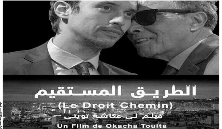
فيلم الطريق المستقيم

أفلام خلال البرنامج الإسباني، وهي "مواجهة الرياح" و"الخليقة المزوجة" و"غارق في الحب" و"الذكرى الأولى". أما في ختام المهرجان فسيتم تكريم الفنانة العالمية ناتالي باي، وهي ممثلة فرنسية، كانت تتعثر في القراءة في مرحلة الطفولة، وتخلت عن دراستها في الرابعة عشرة من عمرها، والتحققت بمدرسة الرقص في موناكو، وفي السابعة عشرة انتقلت إلى نيويورك مع فرقة الباليه الروسي، وعند عودتها اتجهت إلى المسرح والتحققت بفصول سيمون، ثم بالكونسرفتوار قبل أن تعرف مجدها السينمائي.