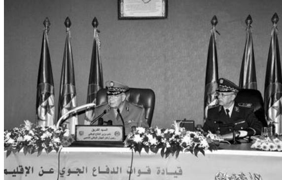
قيادة قوات الدفاع الجوي عن الإقليم

التي تمر بها البلاد، قائلا في هذا الصدد "إن مواقف الجيش ثابتة ولا رجعة فيها وهو يتبع إستراتيجية حكيم ومدرسة، عملت وتعمل على توفير كافة الظروف الملائمة التي تسمح للمواطنين بأداء واجبه الوطني في جوسوده الأمن والأمان والطمأنينة، وإجراء هذه الانتخابات بكافة مراحلها في ظروف جيدة". فيما جدد تحذيره لكل من يحاول التشويش وتعكير صفو الاستحقاق "حيث ستكون العدة لهم بالممرصاد من خلال التطبيق الصارم للقانون". وأشار الفريق إلى "أن ما يهدف إليه الشعب رفقة جيشه هو إرساء أسس الدولة الوطنية الجديدة التي سيتولى أمرها الرئيس المنتخب، الذي يحظى بثقة الشعب وينال رضاه ويمنحه الشرعية الشعبية التي ستمكنه من تجسيد التطلعات الشعبية المتوافقة مع آمال الشباب، وتحقيق مسعى للحاق بركب الدول المتقدمة. كما كان يتمنى الشهداء الأبرار وكما تتطلع وتطمح به الأجيال الصاعدة للجزائر المستقلة".