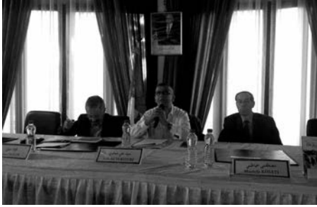
جانبة من الندوة

كتابة التاريخ من منظور علمي؟ هل نخاف من سرد ذاكرتنا الوطنية؟ أين هو النقد والشك في كتابة التاريخ؟ تحسر سوفي على عدم الفصل بين التاريخ الديني وتاريخ الأديان في المناهج التربوية، ليشاغل مجدداً عن مكانة المصادقية في مثل هذه الكتابات.