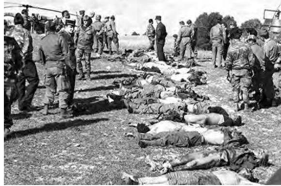
شعبنا طيلة 132 سنة.