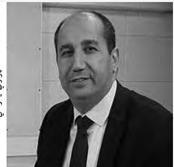
الهوري بن هنري

يهاب السلطات الأخرى، مقترحا في هذا الإطار، سحب هذا التعديل..