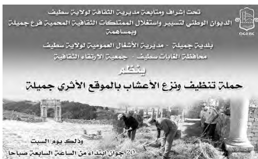
وتشارك في هذه المبادرة الثالثة من نوعها ما يفوق 50 عنصرا من عمال

المتحف "كويكول" ومحافظة الغابات والقسم الفرعي للأشغال العمومية