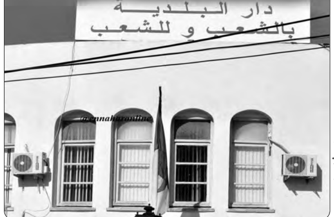
مقر بلدية أولاد فايت

أشهر، بسبب انتشار كوفيد 19، ليستأنف مؤخرا أشغاله، وكذلك الأمر بالنسبة لمقر البلدية، حيث لم يتجدد بعد، وهو ما جعل المجلس البلدي يطالب ببناء مجمع إداري يحرق مستخدمي المصالح من مشكل الضيق، وقد تحقق ذلك، وانطلق المشروع منذ عدة أشهر، لكنه توقف بسبب كورونا، ليستأنف أشغاله في جوان الماضي.