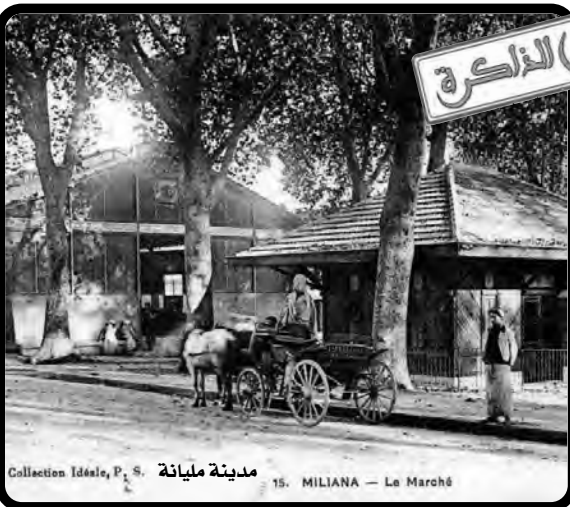
مدينة مليانة 15. MILIANA — Le Marché