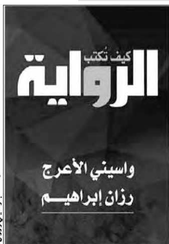
غلاف كتاب واسيني الأعرج وزران

لاحقا، كتب واسيني أيضا على نفس الصفحة: "شكرا للقراء والكتاب والأصدقاء على تبريكاتهم، بمناسبة الإعلان عن صدور كتاب: (كيف تكتب الرواية)، فوجئنا أننا والدكتورة زران، كما فوجئ القراء بهذا التفاعل الرائع والكبير مع هذا الكتاب، الذي يهدد فكرته مغامرة حقيقية، لأنها تفرض مواجهة مع