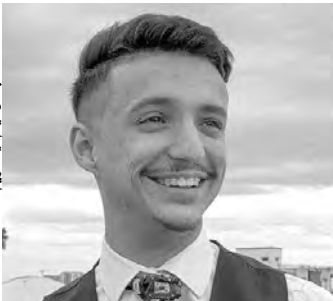
أبطال فيلم "يد مريم"