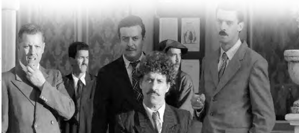
تتمة من فيلم

النشاطات التي فرضتها جائحة "كورونا"، على أن ينظم العرض الأول للعمل بعد العودة التدريجية للنشاطات. يتناول فيلم هيليوبوليس (وهو الاسم القديم لمدينة قالة)، أحداث 8 ماي 1945، عندما خرج الشعب الجزائري محتقلا بنهاية الحرب، مطالبا باستقلاله، قبل أن يواجه من قبل البوليس الاستعماري بالقمع، وعبر ساعتين من العرض، تقف الأحداث عند عائلة قالية بكل تفاصيل يومياتها التي تسبق المجازر، ثم تتوالى المشاهد القاسية التي لا ينساها التاريخ، علما أن أغلبها كان واقعا مرعا عاشه الجزائريون في تلك الفترة للاستعمار.