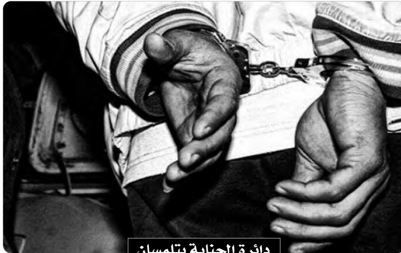
دائرة الحناية بتلمسان