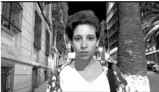
فيلم بنت فاميليا

أيضت، وتجري أطوارها على منصة التواصل "يوتيوب". حسب موقع المهرجان، الذي انطلق يوم الخميس الماضي، وينتهي يوم 3 ديسمبر الداخل، يروي الفيلم الجزائري قصة فتاة في الجزائر العاصمة، تجلس في سيارتها وتخرج علبه سجائر بعناية، فجأة يأتي شاب لطرد بها من جهيم.