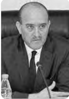
مناصب عمل جديدة وكذا تحسين الإطار المعيشي للمواطنين.

ونقل الوزير تحية رئيس الجمهورية السيد عبد المجيد تبون والوزير الأول السيد عبد العزيز جراد، إلى سكان الولاية، الذين ثمنوا من جهتهم، على لسان المنتخبين المحليين، قرار رئيس الجمهورية بترقية عين قزام من ولاية منتدبة إلى ولاية كاملة الصلاحيات.