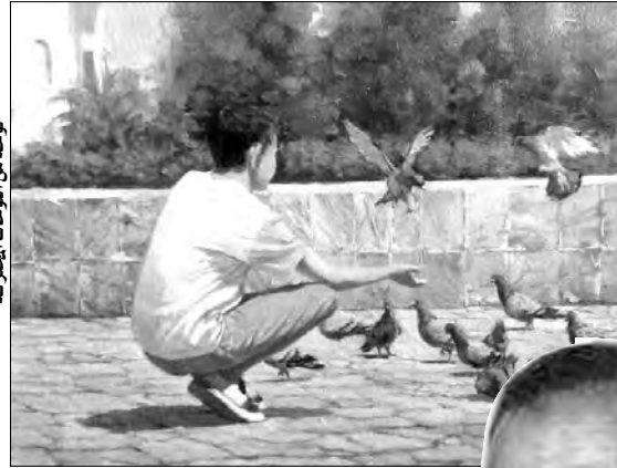
نوع من أنواع الحرق

في نفسه: "ماذا تعني هذه الأعمال وهي حبسية زاوية تحت ردم غبار الستين؟". كما رفض خالد أن يعيد رسم ما احترق؛ فكان كل عمل فني يرفض بشدة أن يكون له شبهة؛ لأنه يعتبر نفسه - وهو على حق - تحفة، لا ترضى بالشريك ولا بالتقليد. وانتقل خالد في الحديث إلى واقع الفن التشكيلي في الجزائر، وقال إنه أمر يعرفه الجيم، وأنه لا يمس وضع الفنان فقط، بل حتى طريقة تعامل المؤسسات مع الفنون التشكيلية، مضيفا: "يجب مراجعة الأسس التي تعتمد في توزيع بطاقات الفنان". كما أكد صعوبة الحديث عن تأسيس سوق للفن التشكيلي في الجزائر في حال عدم وجود نقاد وأخصائيين لتقييم الأعمال مثلا، معتبرا أن تنظيم هذا السوق في شكل تظاهرة فنية سنة 2018، لم يكن وفق معايير معترف بها، وبالأخص تقييم الأعمال من طرف النقاد، مما سبب استياء كبيرا للفنانين، إضافة إلى غياب أسماء