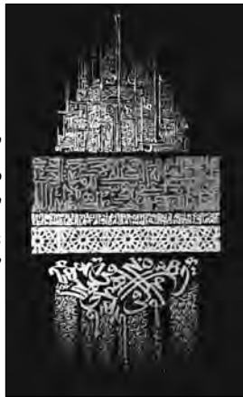
نوع من أنواع الحرق