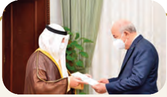
النائب الأول لرئيس مجلس الوزراء الكويتي: