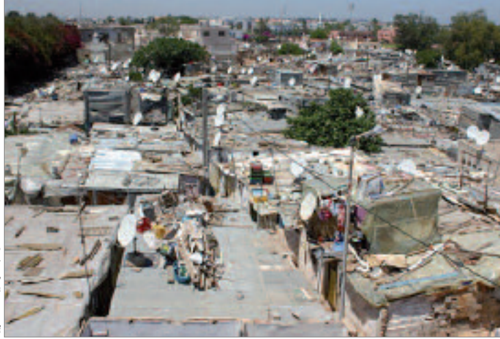
أحد أحياء الدار البيضاء المغربية

ولم يعد سكان أكبر أحياء القصدير بمدينة الدار البيضاء، يتحملون أوضاعهم أكثر وخرجوا إلى الشارع للتعبير عن درجة سخطهم من تدني أوضاعهم المعيشية وسط ظروف لا تبشر بخير، ولكنهم لاقوا ردا عنيفا من تعزيزات قوات الأمن المغربية التي تصدت لهم في محاولة لكتم أصواتهم ومحاصرهم في حدود أحيائهم، وعدم إخراج حقيقة التملل الاجتماعي إلى الواجهة ومنع فضح سلطات مغربية تصر على زعمها أنها تسعى لتحقيق الرفاه للمجتمع المغربي.