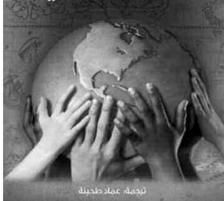
ترجمة: عماد طحينة