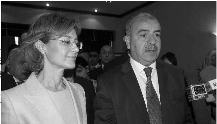
السيد نسب، زينة زيرة الفلاحة الإسبانية