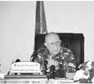
أكد رئيس أركان الجيش الوطني الشعبي، الفريق السعيد شقريجة، أمس، على الرعاية الخاصة التي توليها قياداته للقوات البحرية، من خلال العمل على الرفع المتواصل لقدراتها القتالية والعملية وقوة ردع جعلها "قوة ردع حقيقية".

الشعبي، على المسار الصحيح". مع جعلها قوة رادعة حقيقية، تتماشى سمعتها مع سمعة الجزائر ذات الجذور الثورية العريقة، وتنسجم قدراتها القتالية والعملية مع مختلف المهام والتحديات والتغيرات الطارئة والمتسارعة التي أصبح يتميز بها عالم اليوم.