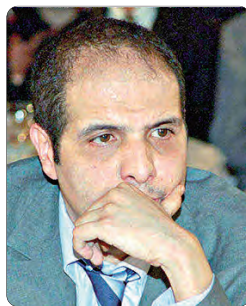
العليا الطعن بالنقض في هذه القضية يعود إلى عدم تأدية الميراث القانونية هو ومضفي البنك منصف بإداسي في المحكمة التي جرت أطوارها نوفمبر 2020.

للإشارة، بعد التماسات النيابة، تواصلت الجلسة المسائية بمرافعة هيئة الدفاع.