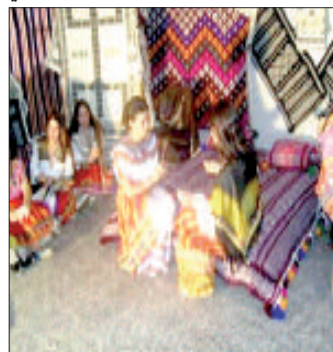
س / زميحي

تستعد قرية آث هيشام الواقعة ببلدية آيت يحيى بدائرة عين الحمام 60 كلم جنوب شرق ولاية تيزي وزو، لإحياء المهرجان الثقافي المحلي للزربية في طبيعته الرابعة ما بين 3 و7 أوت المقبل. التظاهرة تنظمها مدرستا الثقافة والسياحة والصناعات التقليدية بالتنسيق مع المجلس الشعبي الولائي لتيزي وزو وبلدية آيت يحيى، ومن المنظر أن تعرف مشاركة مجموعة من ممارسي الحرف والصناعات التقليدية.