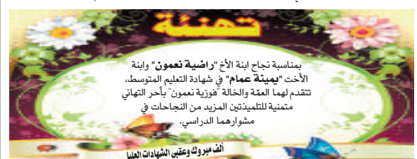
ألمبروك وعيش الشهاديات العليا