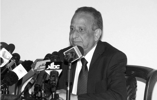
قريّة الشباب عبد القادر خيري

أكد السيد عبد القادر خيري، وزير الشباب، أنه تم تجنيد 1250 إطارا وعونا للسهر على إنجاح خدمات هذه القريّة، التي رُصدت لتجهيزها 20 مليا سنتم، والموجهة لفائدة الشباب لتّرفيه عن أنفسهم والتسلية خلال العطلة الصيفية والسهرات الرمضانية. وأضاف السيد خيري في ندوة صحفية نُشطلها بفندق الجزائر أمّس، أن هذه القريّة قسّمت إلى أحياء، منها الحي الرياضي الذي يضمّ مضمار الدراجات الهوائية الجبلية، مضمار التزلج بالروزلر، البولنج للأطفال، لوحة التزلج، كرة القدم، كرة القدم، بابي فوت، وسباق الدراجات "موتوكروس"، بالإضافة إلى الحي الفني الذي يضمّ فضاء مخصصا للفنون التشكيلية، والتي نجد بها ورشة للرسم الزيتي، الماني، والرسم الفني، ورشة صنّع الأقنعة، وغيرها من النشاطات الحرفية وكذا ورشة صنّعة الفخار. كما تضمّ القريّة حيّا للفنون الغنائية التي تخصّص للموسيقى الشعبية والمهيوّب وكذا المواهب المطربين الشباب، إلى جانب الحي العلمي الذي يتخصّص للمسابقات الفكرية والمعارض العلمية والرصد الفلكي، وكذا الحي الترفيهي الذي رُوّد بمسبح للأطفال، وفضاءات خاصة للعبة الرولر وسباق العقبات، وأيضاً فضاء رياضية الغولف والطائرات الورقية وغيرها، وكذا الكرة الحديدية، كرة السلة وسباق الكيس، مع ألعاب فيديو، شطرنج، دومينو وسكرابل، علاوة على الحي الخاص بالأمسيات الموسيقية، الذي تنظم خلاله حفلات ألعاب من ألعاب وحيل زالقة، ألعاب تقليدية، مهرجين، ألعاب سحرية، وفضاء مسابقة إذاعية للفنان، كما تمّ تخصيص فضاءات للإصاام