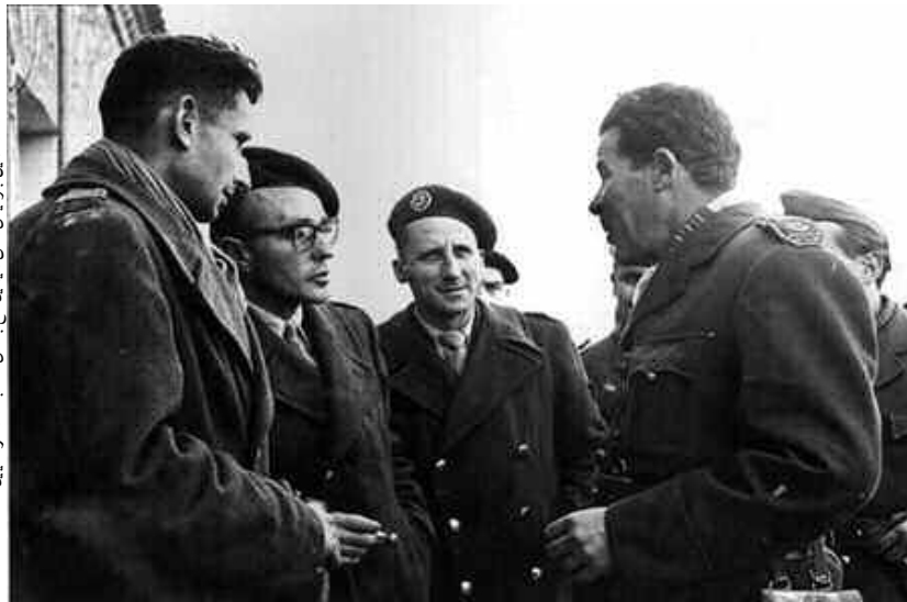
العمل بالوحدات على الجبهة مع بعض الضباط الفرنسيين