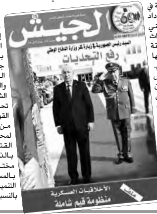
الخلاصات العسكرية منظمة فتح شاملة

وأشارت إلى أن الجيش الوطني الشعبي لم يتخلف عن هذا المسعى الوطني، إذ يواصل تنفيذ مهامه الكبرى والتبليّة المولمة به باحتراق وإقتدار على جبهتين، تتمثل الأولى في الدفاع عن السيادة الوطنية والسلامة الترابية والوحدة الشيعية، بالموافاة مع تحديد وتصرفة مختلف القوات ورفع درجة جاهزيتها من خلال التنفيذ الصارم لمحتوى برامج التحضير القتالي وكذا التمارين البيئية بالذخيرة الحية التي تنفذها مختلف القوات، والثانية بالمساهمة الفعالة في مسيرة التنمية الوطنية مثلاً من خلال بالنسبة للصناعات العسكرية.