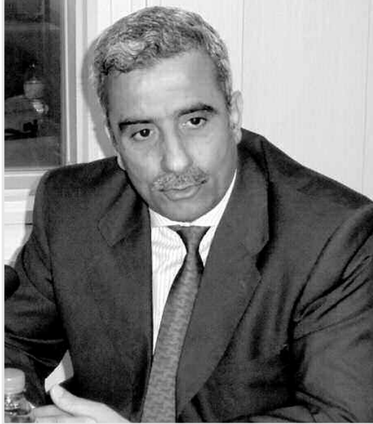
الأسابيع القادمة عملية تهية وإعادة تأهيل، وعلى مستوى ديوان المركب الأولمبي، قُدمت للوزير تفاصيل عن إعادة تأهيل هذه المنشأة الرياضية والتي رُصد لها 260 مليون دينار. وتضمن هذه العملية، كما أوضح المسؤولون

وكشف الوزير من جهة أخرى، عن الانطلاق خلال السنة المقبلة، في أشغال إنجاز ملعب جديد بالشلف يسع 30 000 مقعد، مضافا إلى هذه المنشأة، تتوفر على أرضية مساحتها 80 هكتارا، وهي بالتالي تسمح في المستقبل بتسجيل عمليات أخرى مثل مسبح أولمبي وقاعة متعددة الرياضات من 5 000 مقعد، وعلى مستوى مركز تحضير الفرق الوطنية بالمدينة، تحدث الوزير مطولا مع عناصر من الفرق الوطنية براعم وأشبال كرة اليد والكرة الطائرة، التي توجد في تريض تحضيرية تحسبا للالعاب البحر الأبيض المتوسط التي ستحتضنها إيطاليا العام القادم. وأكد السيد تهمي أنه بعد سنة سيكون مركز تريض الفرق الوطنية للشلف، مركزا ذا مستوى عال.