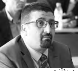
من جهة أخرى.

وأشار محدثنا إلى أن منح التراخيص المؤقتة 27 لاعتماد لاستيراد المركبات من وزارة الصناعة، في انتظار حصولهم على الاعتماد النهائي بعد 30 يوما من ايداعهم ملف طلب الاعتماد، "سيمكن في مرحلة أولى من الاستجابة لاحتياجات السوق، لافتا بالمناسبة إلى أن هذه التراخيص تمثل علامات أجنبية مختلفة ولا تشمل السيارات السياحية فقط، بل تخص أيضا الشاحنات، الحافلات، والنزاجات النارية. وبالتالي فإن نصيب السيارات السياحية التي تلقت إقبالا كبيرا من طرف المواطنين وقد لا يتجاوز 6 أو 6 علامات، على حد تعبيره.