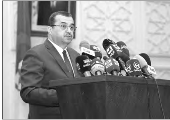
استعجال التوقيع في مجال الهيدروجين

أكد وزير الطاقة والمناجم محمد عرقاب، أمس، بالجزائر العاصمة، أن سياسة الجزائر الطاقوية تهدف إلى المضي بحزم نحو تحقيق انتقال طاقتي "بشكل تدريجي ومسؤول"، وذلك عبر اعتماد مزيج طاقتي أكثر تنوع.