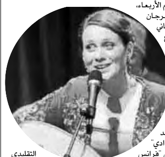
التقليدي النسوي السدي

تحتضن ولاية النعامه، اليوم الأربعاء، فعاليات الطبعه الثالثة للمهرجان الثقافي الوطني لموسيقى وأغاني المرأة، تحت شعار "طبعوس مختلفة وهوية واحدة".