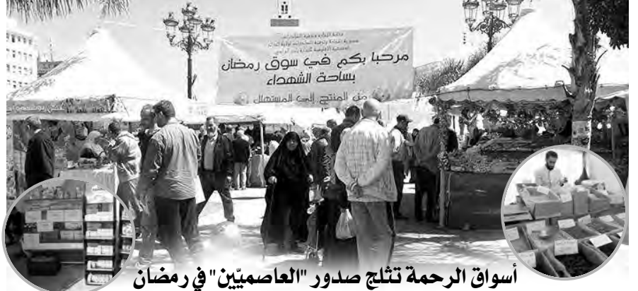
أسواق الرحمة تثلج صدور "العاصمين" في رمضان

كما رخصت مديرية التجارة لمختلف المحلات والفضاءات التجارية الكبرى، باستمرار فترة البيع الترويجي، والبيع بالتخفيض طيلة رمضان المبارك بدون رخصة مسبقة، مع تخصيص فضاءات عرض للمنتجات الحرفية واليدوية بمختلف أسواق الرحمة بالتنسيق مع الجهات المعنية. وتشهد هذه الأسواق إقبالا كبيرا؛ على غرار سوق التضامن ببلدية يومرداس الكائن بمحاذاة المركز التجاري العملاق "تيتانيك"، الذي يُعد من بين أهم الأسواق التضامنية بالولاية، ويشارك فيه 33 عارضا يمثلون منتجين وتجار جملة لمختلف