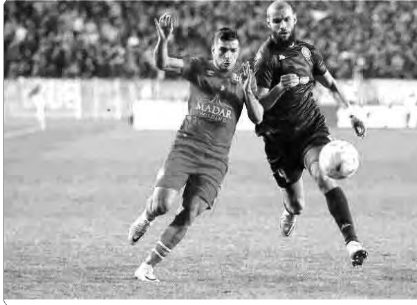
يبتزو أتلتيكو (7) وهيتا كلوب (4 ن)، المنافسة. النهائي يوم الأربعاء 5 أبريل 2023 بالقاهرة المصرية، ابتداء من (19:30) بتوقيت الجزائر.

في المباراة التي جرت بملعب رادس بتونس، فشل شباب بلوزداد في الإطاحة بمضيفه الترجي التونسي، ليفشل في حسم صدارة المجموعة الرابعة لصالحه، وبهذا التعادل أصبح رصيد الترجي 11 نقطة في المركز الأول، متقدما على الوصيف شباب بلوزداد بنقطة واحدة، ضامنا بذلك تأهلها إلى الدور ربع النهائي، فيما يغادر الزمالك (7 ن) والمريخ (5 ن)، المنافسة.