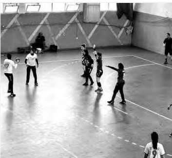
أندية (نادي الأبيار، مولودية الجزائر ونادي بومرداس)، حيث سيتوج صاحب المركز الأول في الترتيب العام بالكأس.

ويكفي التعادل فتيات بومرداس، اللاتي يتوفرن على نقطتين للتتويج بأول لقب في تاريخهن، مقابل نقطة واحدة للأبيار والمولودية، هذه الأخيرة، أقصيت من المنافسة، بعد خوضها مباراتين. أما نادي الأبيار، فهو مطالب بتحقيق الفوز، لإضافة لقب آخر إلى سجله الثري. كانت الاتحادية الجزائرية لكرة اليد، قد قررت تنظيم الكأس الممتازة (سيدات) لسنة 2022، بصيغة بطولة مصفرة، بين ثلاثة