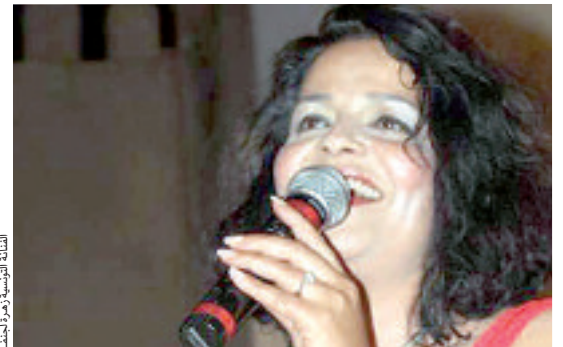
الفرقة التونسية زهرة لجنف

الجمهور الذي خصها باستقبال رائع وتجاوب معها أداء وتصفيقا. كما أشادت الفنانة التونسية بالوقفة التضامنية مع الشعب الفلسطيني، لتتحدث بمرارة وحسرة عن الصمت العربي وغياب الضمير الإنساني العالمي أمام ما يجري من مجازر بشعة في غزّة الجريفة، مؤكدة أن تواجدها بالمهرجان هو فرصة لضم صوتها للأصوات الداعية لنصرة غزّة والتضامن مع الشعب الفلسطيني والتبديد بالعدوان الإسرائيلي على الأبرياء. وحيث، بالمناسبة، الديوان الوطني للثقافة والإعلام وكل الفنانين والأسرة الإعلامية؛ لارتباطهم بمبادرة التضامن من غزّة، أمله في العودة لمهرجان تيمقاد في أجواء أحسن من أجواء الحرب على غزّة. وأشادت الضيفة التونسية بمستوى مهرجان تيمقاد، الذي وصل إلى مصاف المهرجانات الفنية العالمية نتيجة التنوع في برامجه، واعتبرت ذلك دعما آخر للتواصل الفني وتقديم التراث. والفنانة مصرة على الاستمرار في التعامل مع التراث في مشوارها الفني.