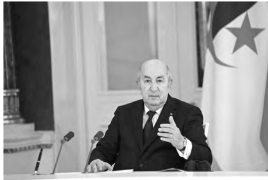
(الجزائر). زيارات (موريتانيا) على مسافة 800 كلم.

أكد رئيس الجمهورية، عبد المجيد تبون، أمس، خلال أشغال قمة روسيا-إفريقيا بسانت بطرسبورغ، أن الجزائر تتطلع لبناء شراكة إفريقية روسية قوية ومربحة للطرفين من أجل بروز نظام دولي عادل، مبرزا الجهود الجزائرية الكبيرة في دعم التنمية في القارة لاسيما للحد من المديونية وتطوير البنى التحتية في العديد من دولها. أين ب