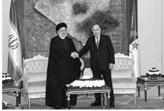
المتمندى الدول المصدرة للغاز التي احتضنتها الجزائر السبت الماضي، أكد السيد رئيسي أن هذه القمة كانت موفقة جدا، معتبرا أن الكلمة القويات المفروضة عليه إلى فرص اقتصادية قوية جدا. ولي تطلعه إلى مشاركته في القمة السابعة

التي ألقاها رئيس الجمهورية، السيد عبد المجيد تبون لدى افتتاحه أشغال هذا الموعد الدولي الهام كانت مهمة جدا، من خلال دعوته إلى رسم رؤية مشتركة بين الدول الأعضاء في المنتدى للحفاظ على مصالح المنتجين والمستهلكين، وضرورة تعزيز التعاون والحوار بين الدول الأعضاء. من جهة أخرى، تحدث الرئيس الإيراني عن زيارته إلى جامع الجزائر الذي وصفه بأنه صار معلم ديني كبير، مؤكدا أنه سيلعب دورا كبيرا في تعزيز الروابط بين الشعوب الإسلامية، متمنيا للشعب والشباب الجزائري العيش في كنف الصلح والأمن والثبات. وفي رده على سؤال حول علاقة إيران مع الدول العربية، أضاف رئيسي بتطور علاقات بلاده مع الجزائر، كما اعتبر مساعي التطبيع التي تقوم بها إسرائيل من خلال نسجها لعلاقات مع دول إسلامية وإقليمية، لم تنجح في تحقيق الأمن والأمان للكيان، مضيفا أن إيران ليست لديها مشكلة مع الدول العربية، رغم محاولات تقديمها