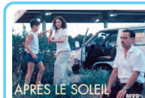
APRÈS LE SOLEIL

في قاعات العرض والمؤسسات المرموقة في جميع أنحاء العالم، ويتميز بقدرته على التقاط جوهر موضوعاته بحساسية عميقة ونهج مبتكر، مما يجعله شخصية بارزة في السينما المعاصرة.