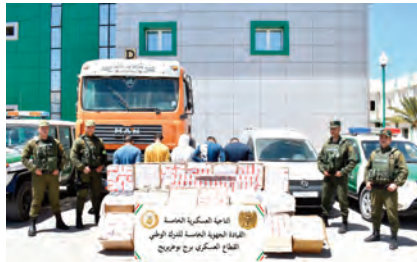
الحدود مع المغرب، فيما تم ضبط 3,370 كيلوغرام من مادة الكوكايين

من جهة أخرى، تمكن حراس السواحل من إحباط محاولات هجرة غير شرعية بالسواحل الوطنية 261 شخصا كانوا على متن قوارب تقليدية الصنع، فيما تم توقيف 157 مهاجر غير شرعي من جنسيات مختلفة عبر التراب الوطني.