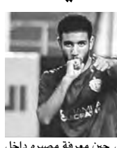
عروض إلى حين معرفة مصيره داخل