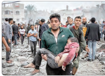
الأونروا" بمخيم النصيرات. وهذه المدارس التي يتجاوز عددها 10 في مخيم النصيرات تضم أكثر من 80 ألف نازح، وكذلك يستهدف تجمعات النازحين المدنيين بشكل عام خاصة في مواصي خانينوس التي زعم الاحتلال

وأضاف البيان بأن هذه المجازر تأتي في ظل إسقاط الاحتلال الصهيوني للمنظومة الصحية وتدمير وإحراق المستشفيات وإخراجها عن الخدمة، وفي ظل الضغط الهائل على الطواقم الطبية وما تبقى من غرف العمليات الجراحية، وفي ظل نقص المستلزمات الصحية والطبية، وفي ظل إغلاق المعابر أمام سفر الجرحى والمرضى وعدم إدخال الوقود، وفي ظل كارثية الأوضاع الإنسانية والصحية.