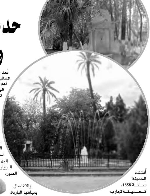
أنشئت الحديقة سنة 1858، كحديقة تجارية للنباتات؛ حيث تحتوي على بعض الأصناف النباتية النادرة مثل تلك الموجودة على مستوى حديقة الحامة بالعاصمة. وفي سنة 1890 خلال الاستعمار تم تسمية الحديقة باسم "بيزوت"؛ تكريما لضابط في الجيش الفرنسي. وبعد الاستقلال وفي سنة 1968، حُولت إلى حديقة عامة مفتوحة للجمهور الراغب في الدخول إليها والاستمتاع بجمالها. وأطلق عليها اسم "باتريس لومومبا" تكريما لزعيم الاستقلال الكونغولي.

وحسب مدير البيئة لولاية البليدة وحيد تشاشي في تصريحه لـ "المساء"، فإن حديقة باتريس