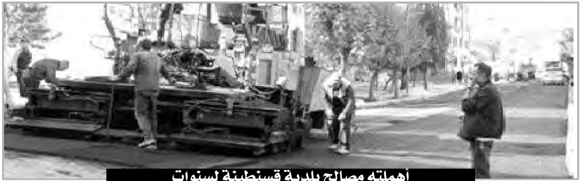
أهمته مصالح بلدية قسنطينة لسنوات