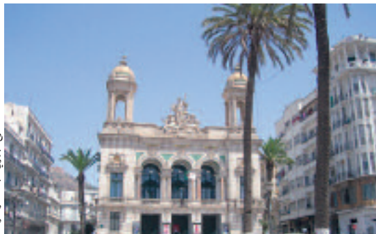
المسرح الجهوي عبد القادر علولة

الفنية، معتبرين الإعلان فرصة سانحة وثمينة لهم بغية البروز في الساحة الفنية والتعريف بمواعيدهم. وفي انتظار أن يقع اختيار إدارة المسرح الجهوي على الفرقة الموسيقية المناسبة التي ستشارك في الحفل، تكف هذه الأخيرة على ضبط برنامجها الفني والثقافي قصد الاحتفال بالذكرى الستين لاندلاع الثورة التحريرية المباركة، سواء تعلق الأمر بالمعرض المسرحية أو الحفلات الموسيقية الوطنية.