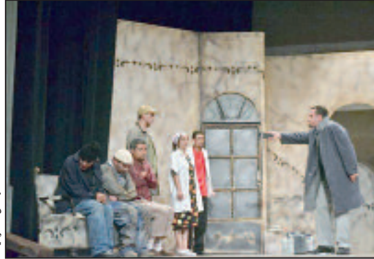
وتنتهي المسرحية بهدم مبنى الفندق في ليلة مليئة بالشك بخصوص مقتل مفتش شرطة كان يحقق في هوية زلاّء الفندق، حيث تعرّض للقتل خطأ أثناء أداء مهامه بيهو المنزل، ولأن السلطة لا