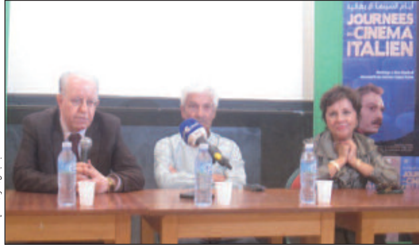
جانب من الندوة الصحفية