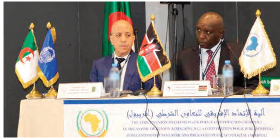
آلية الاتحاد الإفريقي للتعاون الشرطي (أفريقيول) LE COMITE D'UNION AFRICAINE POUR LA COOPERATION POLICIERE (AUCPC) EL COMITE DE UNION AFRICAINE PARA LA COOPERACION POLICIERA (AUCPC)

التحديات المتنوعة التي تعرفها القارة، وذكر بدور الجزائر في تعزيز التعاون مع أفريقيا، حيث قامت منذ إنشاء هذه الآلية بتقديم كل أشكال الدعم والمساعدة على مختلف الأصعدة، في خدمة التعاون الشرطي الإفريقي، مشيراً إلى تخصيصها لهذه المنظمة مقراً يتناسب مع مهامها، وتجهز بكل المرافق الأساسية وفق المعايير الدولية.