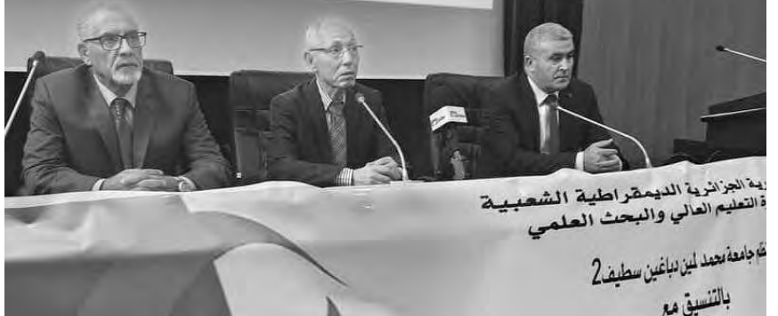
بعض المشاركين في الملتقى الوطني الخامس، الموسوم "تفجير الثورة التحريرية بين واقع الحركة الوطنية وجهود النخبة الثورية 1954-1950"، احتفنته جامعة "محمد بن دباغين" (سطيف 2)، أول أمس، أن وحدة الفكر النضالي لدى النخبة الجزائرية، كان لها دور بارز في تعبيد الطريق لتفجير تلك الثورة.