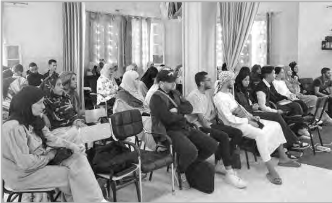
بالمشروع، تعرف تقدما ملحوظا.