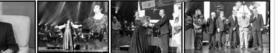
أوبرا الجزائر "بوعلام بسايح"