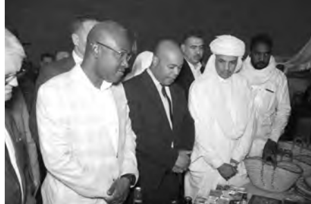
شأنه إعطاء ديناميكية جديدة لقطاع الشباب والاستثمار في المؤهلات المتاحة، بما في ذلك هيكل قطاع عصرية تدعم الإبداع والابتكار.

للإشارة، استهل وزير الشباب المكلف بالمجلس الأعلى للشباب، زيارته إلى تيميمون بالإشراف على انطلاق حملة تشجير واسعة بقصر تالة 12 كلم شمال تيميمون، بمشاركة متطوعين يمثلون مصالح محافظة الغابات والهلال الأحمر الجزائري والكشافة الإسلامية الجزائرية وجمعيات محلية إلى جانب الشباب المشاركين في هذه التظاهرة، وذلك قبل قيامه بجولة في أجنحة معرض منتجات الصناعات التقليدية نظم بالمناسبة.